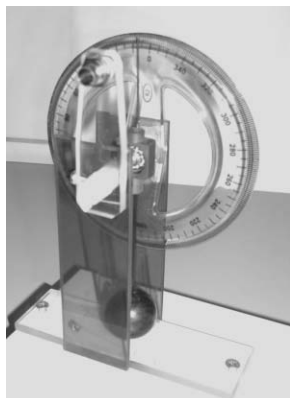
1. kép. Inga az állványon