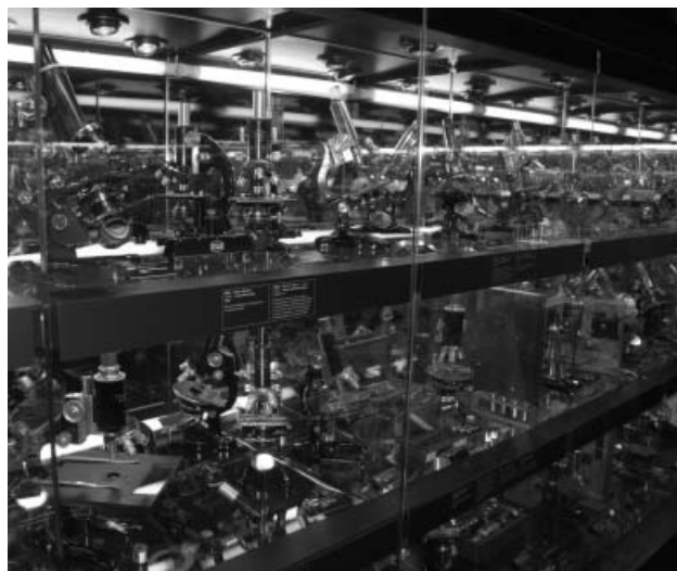
7. kép. Részlet a Lézerpont látványtár egyik kiállításából.