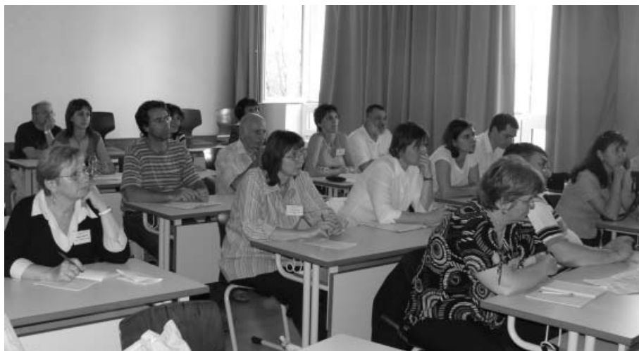
4. kép. A kollégák nagy érdeklődéssel figyelik az egyik műhelyfoglalkozást.

előadásaiból nyerhettünk bepillantást a nanokutatásokba. Elsőként Pungor András igazgató úr mesélte el a „BAY-NANO sztorit” és röviden ismertette az intézetben folyó kutatási irányokat. Ezután Hegman Norbert vezetésével „barangoltunk a nanoméreték világában”, majd ismét Pungor András következett, aki a „félreértett kísérletek” oldaláról mutatta be az atomerő-mikroszkóp (AFM – Atomic Force Microscope) történetét. Ezek után Kőhidai Lászlótól hallhattunk a sejtélettani paraméterek vizsgálatáról és ezek méréseiről. Őt