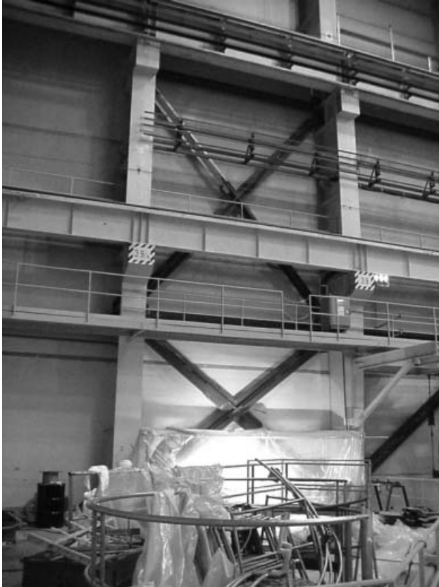
2. ábra. Hosszirányú megerősítések a reaktorcsarnokban.

ismertetni: több mint 2500 tonna acélszerkezetet építettek be az erőmű megerősítésére.