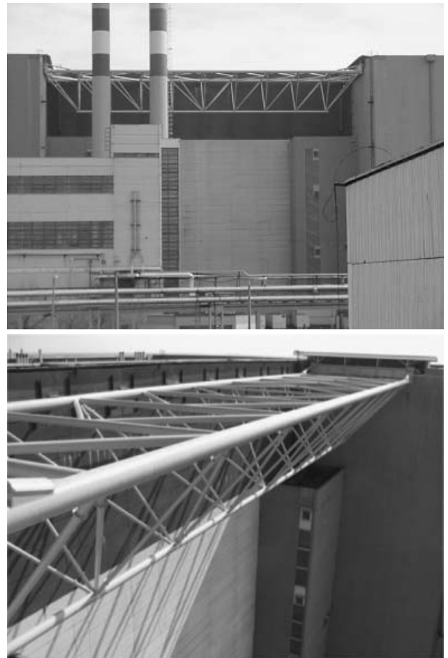
3. ábra. Hídszerkezet a lokalizációs tornyok közötti reaktorcsarnok szerkezetének megerősítésére.

A program keretében kidolgozták az üzemeltető személyzet számára azt az üzemzavar-elhárítási utasítás-rendszert, ami meghatározza a teendőket földrengés esetén. Az ilyen helyzet kezelése a személyzet rendszeres képzésének ugyanúgy része, mint bármely más rendkívüli eseményé. Földrengés esetén a paksi atomerőmű a védelmi működéseknek köszönhetően leáll, ha bármely rendszer sérül, de rendelkezésre állnak azok a megerősített technológiai rendszerek, amelyek segítségével az atomerőmű biztonságos állapotban tartható. Az ekkor szükséges technológiai műveleteket, a személyzet tevékenységét, illetve az atomerőmű föld-