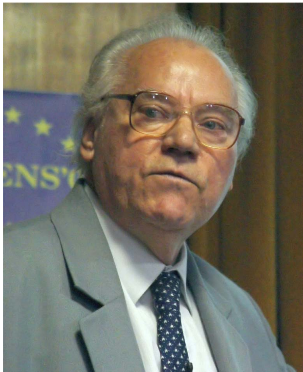
A professzor úr 2005 nyarán.

Tudta: közeli és távoli kapcsolatok nélkül, tartalmas együttműködések hiányában a bezárkózás ve-