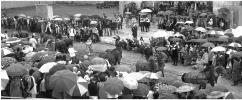
Guericke magdeburgi féltekék-kísérlet a Ferences kertben 2003-ban (Fotó: Czika László)

sok fizika alapozó képzését végzi, és így mintegy 220 hallgatója van a tanszéknek. Célunk mesterképzés indítása is fizika szakon.”