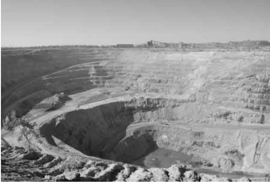
1. ábra. A Ranger külszíni uránbánya Ausztráliában.

zömmel Amerikában, Európában és Indiában. Tekintve, hogy a tóriumot még nem kutatták meg olyan mértékben sem, mint az uránt, a reménybeli készletek ennek sokszorosát tehetik ki.