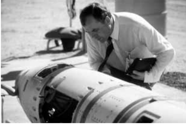
3. ábra. Szovjet ellenőr vizsgál egy robbanófejtől megfosztott Tomahawk rakétát.

Egy kiszemelt fűtőelem eredetileg 3 évet töltött a reaktorban, de két évtizede a legtöbb helyen ezt 4 évre növelték. Így az elmúlt 40 évben elhasznált dúsított urán mennyisége 35\,700 \times 40/4 = 357\,000 tonna. A dúsítás tárgyalásakor láttuk, hogy ennek mintegy 6-szorosa fogyott el a dúsításakor, vagyis a teljes elfogyott uránmennyiség 2,1 Mt-ra becsülhető. A dúsítóművekből származó maradéka 1,8 Mt szegényített urán.