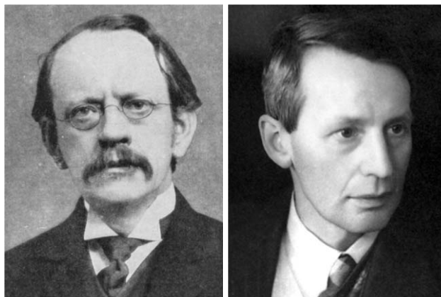
1. ábra. Sir Joseph John Thomson és Sir George Paget Thomson

Eredményeit legtöbbször kiváló tanítványaival együtt érte el. Nagyon jó érzékkel válogatta ki és vette őket maga mellé a Cavendish Laboratóriumba, mun-