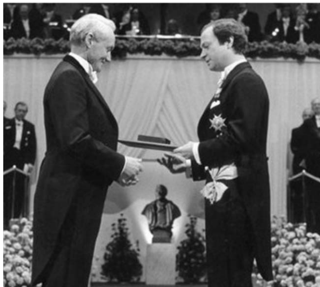
4. ábra. Kai Manne Björne Siegbahn átveszi az 1981. évi fizikai Nobel-díjat Carl Gustaf svéd királytól.

Akárcsak apja, Kai Siegbahn is az atom szerkezetét kutatta, de ő nem az atomból kilépő karakterisztikus röntgensugárzást analizálta, hanem kemény röntgen-