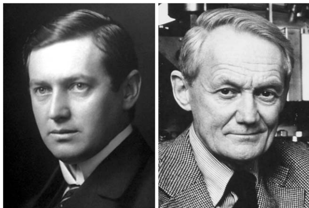
3. ábra. Karl Manne Georg Siegbahn és Kai Manne Björne Siegbahn

Édesapja állomásfőnök volt a svéd államvasutaknál, édesanyja a háztartást vezette.