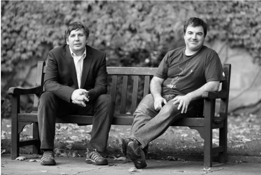
Andre Geim és Konstantin Novoselov 2010. október 5-én, a Nobel-díj kihirdetésének napján a Manchesteri Egyetem kertjében.

get, amely már önmagában is lilás interferenciaszín eredményez. Azokon a helyeken pedig, ahol grafénlemezek találhatók (tipikusan a néhány mikronos laterális méretben), a fázistolás következtében az interferenciaszín kissé megváltozik, azaz nem intenzitásbeli, hanem színbeli kontrasztot kapunk. Ezzel az ötlettel már egy közönséges optikai mikroszkópban is könnyen azonosíthatóvá váltak a csupán egyetlen atomréteg vastagságú grafénlemezcskék.