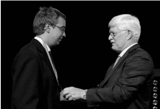
Szabó Attila a kétszeres olimpiai abszolút győztes

ügyesebb gyerekeknek. Mindez komoly múltra tekint vissza. A jelen eredményei azt sugallják, hogy a szerény és kiszámíthatatlan ütemezésű állami támogatás mellett (és ellenére) is működik ez a versenyrendszer. A jövő kicsit bizonytalan. A „nagy” versenyek motiváló ereje sokat gyengült, amikor megszüntették azt, hogy az egyetemi felvételnél beszámítsanak az ezen versenyeken elért eredmények. Ez a versenyekre való jelentkezési számokból egyértelműen látszik. A Szilárd-versenynél például az oktatási kormányzat annak ellenére sem volt hajlandó felvételi pontszámokkal elismerni a teljesítményt, hogy öt nagy egyetem természettudományi karának dékánjai emelték fel a szavukat ennek érdekében. Az Eötvös Loránd Fizikai Társulat pedig minden oktatási kormányzatot megkeresett már a nagy múltú és magas színvonalú fizika-versenyek felvételénél történő figyelembe vételével kapcsolatban – hiába. Itt sokat lehetne tenni egyszerű adminisztratív intézkedésekkel, amihez még pénz se kellene. Azt viszont biztosan lehet tudni, ha ez a most jól működő rendszer egyszer összeomlik, akkor újrászervezni csak nagy munkával lehetne. A tehetség-gondozást az iskolai szakkörökre kéne építeni. Iszo-