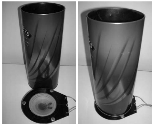
4. ábra. Akusztikus rezonátor.

Egyik napsütéses reggelen arra lettem figyelmes, hogy egy kerek tálban lévő víz milyen szépen veri vissza a falra a fényt. Csakhogy a folt nem volt mozdulatlan: minden apró, asztalt érő mechanikai hatás gyönyörű állóhullámokat produkált. Egy ideig még kocogtattam az asztal lapját, de közben a Nap odébb állt. Elhatároztam, hogy megismétlem a kísérletet „laboratóriumi” körülmények között. Napfény helyett lézert fényt használtam. Szerettem volna hallható tartományú hangfrekvencián működtetni a „berendezést”, de a víz túl lomhának bizonyult, nem sikerült a nagy amplitúdójú, látványos állóhullámok előállítására. Ekkor jött az ötlet, hogy víz helyett rezgetessünk valami könnyű fényvisszaverő felületet. Jó választásnak