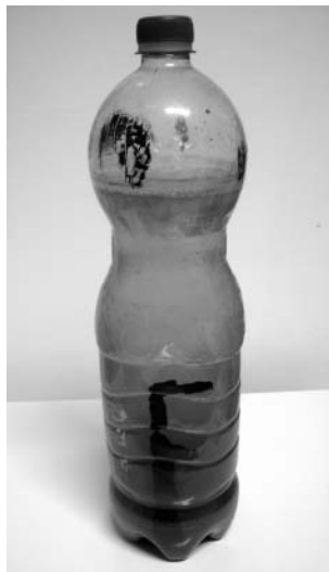
3. ábra. Mágneses folyadék.

A gázkazán cseréje nem örömteli esemény, főleg, ha mindez a fűtési szezonban történik. De nézzük a dolog jó oldalát! Egy ilyen eset rendkívüli alkalom a fűtőrendszer alapos átmosására, tisztítására. Meglepően fekete víz folyt ki a csövekből. Megtöltöttem vele egy műanyagpalackot. Hetek teltek el, míg az iszap szerű anyag leülepedett. Az üledék apró szemcséi könnyen mozgathatók kívülről egy mágnes segítségével. Az edény falára mintákat lehet rajzolni. Egy kis fantáziával más érdekes kísérletek elvégzésére is alkalmas lehet (3. ábra).