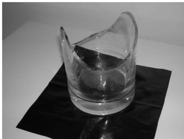
1. ábra. Az egykori kancsó.

kancsó földi maradványai közül az egyik darab még jó fél perc múlva is az oldalán fekvő előre gördült, majd hátra. Több másodperces periódusidővel ismétlődött meg a mozgás. A törés okozta enyhe aszimmetria miatt a tömegközéppont az eredetihez képest kissé eltolódott. A keletkezett törésvonalak jól illeszkednek a síkhoz. A közel félkör alakot valószínűleg a becsapódásakor a kerület mentén kialakuló állóhullámok eredményezték. A duzzadóhelyek vetettek véget a kancsó konyhai pályafutásának ( 1. ábra ).