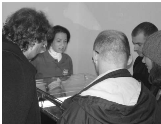
Milyen nyomok láthatók a diffúziós ködkamrában?

Hétfőtől csütörtökig a délelőtti órákban az előre bejelentkezett iskolás csoportok adták egymásnak a kilincset rendhagyó fizikaóráinkon. Voltak tisztán elméleti órák, kísérletekkel fűszerezettek és kimondottan kísérleti jellegűek. A legnagyobb sikert most is a hidegfizikai bemutató aratta, ahol folyékony nitrogénnel végzett kísérletek közben a gyerekek megismerkedtek az anyag tulajdonságaival és a hőmérsékleti skálákkal. A rendhagyó órák színes palettájára felkerült az Atomki disszeminációs programja keretében működő Utazó fizika eddig elkészült két előadása: a Víz és a Földünk természetes védelmi rendszerei . Ezekkel az előadásokkal egyébként az észak-alföldi régió hátrányos helyzetű kistérségeinek középiskoláit látogatjuk meg, videóra vett változatuk már az internet népszerű fájlmegosztó portálján is elérhető.