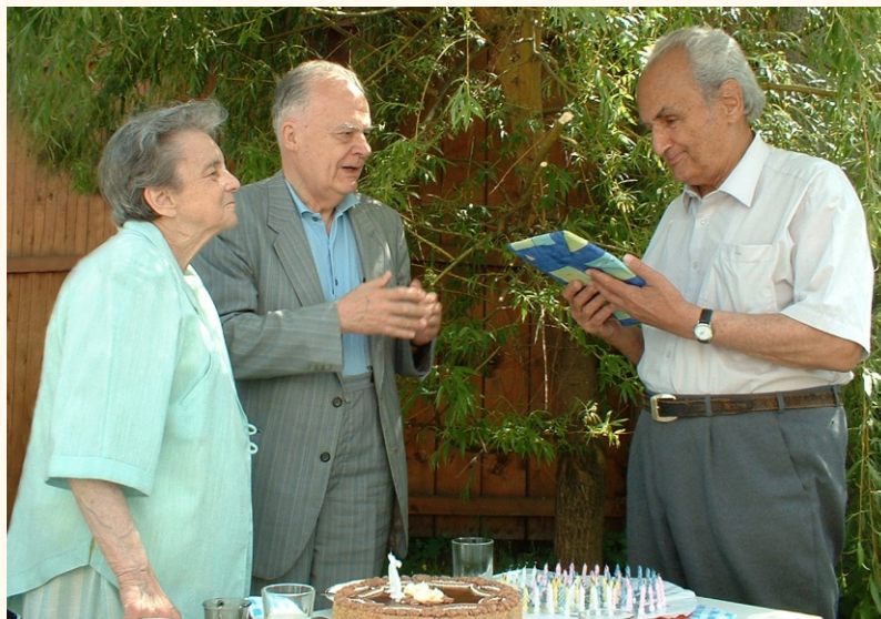
Turi Zsuzsa és Pál Lénárd a Fizikai Szemle ünnepi számával köszöntik Marx Györgyöt Mátradereszkén, 75. születésnapján, 2002 májusában.

Az adott ügy iránti elkötelezettség jellemezte felelős szerkesztői munkáját is. Saját írásaim korrektúrájánál, bírálataimnál, konferenciaszervezéseknél nem volt elég a levélváltás, a telefonálás, több esetben személyes megbeszélést is kért. Egy alkalommal az MTESZ központi, Kossuth téri főtitkár-helyettesi irodájába kellett hozzá mennem. Meglepett, hogy munkatársai milyen nagy tisztelettel övezték Őt. Ez ellenében állt azzal a kollegiális, közvetlen hangulattal,