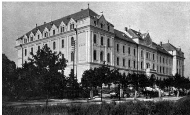
Az Eötvös Collegium 1911-ben átadott épülete.