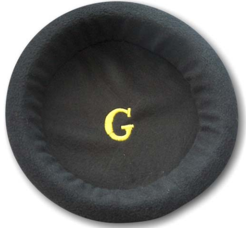
8. ábra. A „ragasztó” gluont szimbolizáló fekete párna.

Természetesen jelentősen egyszerűsítet a modellem, hiszen nem beszélek arról, hogy nyolcféle gluon van, nekik is van „színük”, azaz színtöltésük, továbbá léteznek még úgynevezett tengerkvarkok is a protonban, illetve a neutronban. Ezek megbeszélésére normál órán nincs idő, ez kifejezetten csak szakkörön lehetséges. Azt viszont megjegyzem, hogy kvarkok szabadon, önmagukban csak a világegyetem kialakulásának kezdeti időszakában léteztek, jelenleg természetes körülmények között már csak kötött állapotban fordulnak elő. Az univerzum ezen kezdeti korszakát,