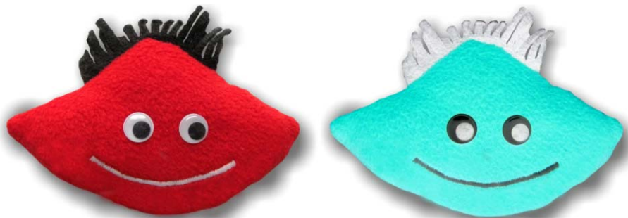
20. ábra. A piros up kvark és antirészecskéje az „antipiros” – invertált piros színű – antiup kvark.

által meghirdetett Fizika a tudományokban és művészetekben versenyen.