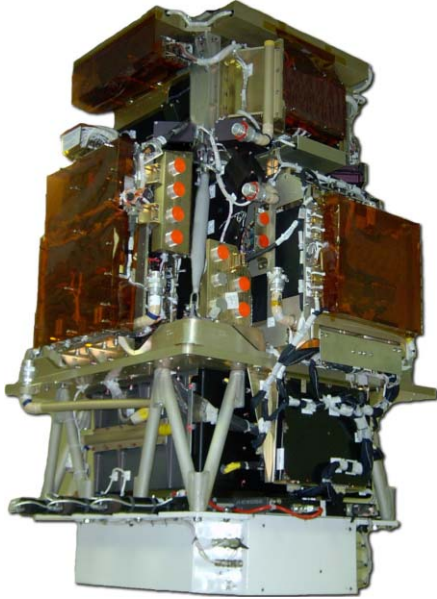
7. ábra. A PAMELA (Payload for Antimatter Matter Exploration and Light-nuclei Astrophysics) műszer. http://pamela.roma2.infn.it/index.php?option=com_mjfrontpage&Itemid=159

részecskék megzavarhatják a körülöttünk keringő – például távérzékelő, távközlő – műholdak elektronikai rendszerét. A 2005. január 20-i napkitörés során olyan erőteljes fluxusú protonkilökődés történt, amely 15 perc alatt érte el a Földet, szemben az átlagos 2 napnyi időtartammal [2].