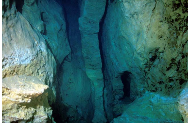
11. ábra. A Molnár János termálbarlang Budán. http://label.web.cern.ch/label/MolnarJanos.html

Megemlíthetjük az MTA KFKI Részecske- és Magfizikai Kutató Intézet és az ELTE által közösen fejlesztett gáztöltésű müondetektort, amely extrém körülmények között is használható és előállítása sem költsé-