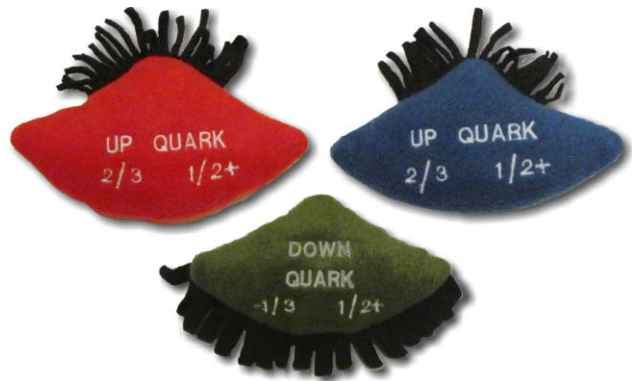
4. ábra. A proton elemi „építőpárnáskái”: a két up és egy down kvark.

nak, hogy ezen kvarkok színeit nem véletlenül választottam pirosnak, kéknek és zöldnek, hiszen – az elektromos és spintöltés (perdület) mellett – a kvarkoknak még úgynevezett színtöltésük is van, és ezek összege a fehéret kell kiadja. Így említem meg nekik a kvantum-színdinamika fogalmát, amely a részecskefizika hangsúlyos kutatási területe. Itt lehet rámutatni, hogy – bár sokan még csak nem is hallottak e tudományterület létezéséről – a szuperszámítógépek felhasználásának jelentős területe ez a kutatás.