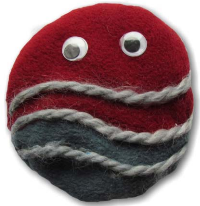
12. ábra. A tau-részecske, a tripla szávjonal a részecske extrém nagy tömegére utal.

Az elektron és müon mellett néhány szót érdemes ejteni a tau-részecskéről (12. ábra) is, amely szintén a Standard modell egyik leptonja. Ezt a részecskét 1975-ben fedezték fel a kaliforniai SLAC (Stanford Linear Accelerator Center) részecskegyorsítóban. (A SLAC a világ legnagyobb lineáris részecskegyorsítója, 3,2 km hosszú, ezért tervezésekor a Föld alakját is figyelembe kellett venni.) A felfedezés érdekessége, hogy az nem közvetlenül történt, hanem a tau létezésére a bomlási folyamat energiamérlegének hiányából lehetett következtetni. Elektromos töltése az elektron töltésével megegyező. Élettartama 10^{-13} s, tömege körülbelül kétszerese a protonénak. Ez az egyetlen olyan lepton, amely hadronokká is képes bomlani. Felfedezéséért Martin Lewis Pell 1995-ben Nobel-díjat kapott.