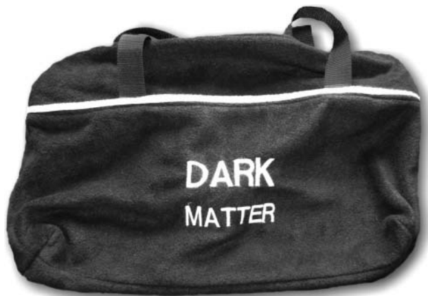
1. ábra. A részecskék tárolására szolgáló „sötét anyag”.

– azaz az Európai Űrügynökség, amelynek idén novemberben hazánk is teljes jogú tagja lett – állította pályára, ilyen jellegű megfigyelések céljából.