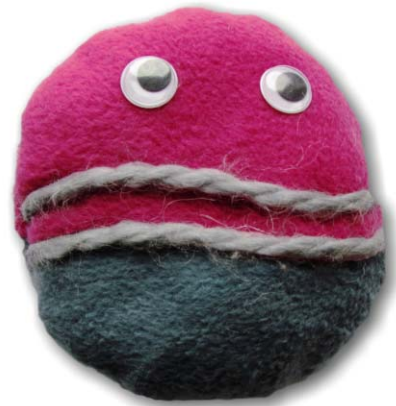
9. ábra. A müön, a dupla szájjvonal a mintegy 200-szoros elektron-tömegre utal.

A következő részecske, a müön a speciális relativitáselmélet tanításánál jut főszerrephoz, amikor elmondjuk, hogy a Földön is érzékelhető müönök az idődilatáció bizonyítékai. Ekkor már megmutatom a Standard modell hivatalos táblázatát és az általam tervezett figurák beillesztésével készült képét (színes ábra az első belső borítón), hogy el lehessen képzelni a müön helyét a már megismert kvarkok és elektron mellett.