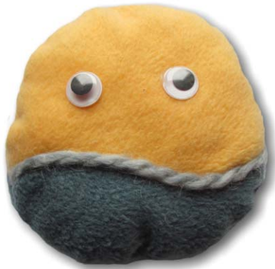
3. ábra. Az elektront szemléltető figura.

előkerül a kis gömbölyű részecske. Elmondom a diákoknak, hogy a két szem alá azért nem száj, hanem egy hullámvonal került, mert – kísérletileg is bizonyított – az elektronnak hullámtermészete is van. Az elektron tervezésekor azért fektettem erre hangsúlyt, mert ez az elsőként bemutatásra kerülő részecske. A többi részecskénél – ez után – a kettős természet már könnyebben elfogadható. Mindig megjegyzem, hogy az elektron tovább már nem osztható, így elemi részecske. Fontosnak tartom a diákok figyelmét felhívni arra, hogy – a középiskolában tanított kémiában valamilyen értelemben az elektronnal egyenrangú részecskének, mint atomi összetevőnek tekintett – proton és neutron már nem elemi részecskék, ugyanis mindkettőjüket 3-3 kvarknak nevezett elemi részecske alkotja. Itt a figurák segítségével bemutatom, hogyan épül fel a proton két up és egy down kvarkból, hogy végül kijöjjön a töltések összegeként a +1 töltés (4. ábra), illetve a neutronnál két down és egy up kvarkból kialakul az elektromosan semleges neutron. A két kvark megkülönböztetésére az up kvarknál frizurát, a down kvarknál szakállt terveztem. Az up és down kvarkok alakját olyan körcikknek választottam, amelyekből 3 darab (5. ábra) együtt alkot egy egészet (protont vagy neutront). Elmondom a diákok-