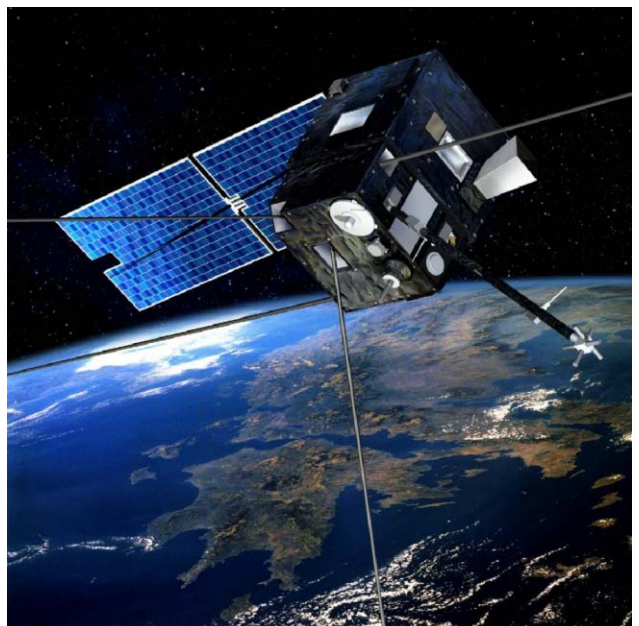
6. ábra. A DEMETER-űrszonda.

A protonok tárgyalásakor képzeletben elhagyhatjuk bolygónkat és megemlíthetjük a DEMETER (Detection of Electro-Magnetic Emissions Transmitted from Earthquake Regions) műholdat (6. ábra), amely 2004 nyara óta kering bolygónk körül 730 km magaságú poláris, közel napszinkron pályán, és így detektálni tudja a sugárzási övezetekből érkező elektronokat és protonokat. Fontos, hogy a diákokban a proton és az elektron fogalma ne csak az atom alkotórészeként legyen jelen, hiszen a napkitörések során nagy mennyiségű töltött részecske érheti el a Föld környezetét és légkörét. A kedvezőtlen üridőjárás, azaz e