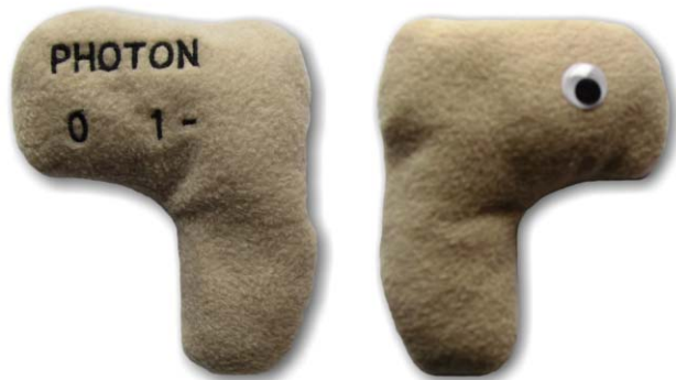
15. ábra. A foton, mint részecske.

anyagról. Volt viszont egy másik sugárzás is, ami már jóval korábban lecsatolódott. A neutrínók már 2 másodperc után szabadon mozoghattak és ezért elképzelhető, hogy a neutrínók segítségével az univerzum keletkezése utáni két másodperccel történt eseményekről is szerezhettünk ismereteket. Ennek megvalósítása még a jövő kihívása [5].