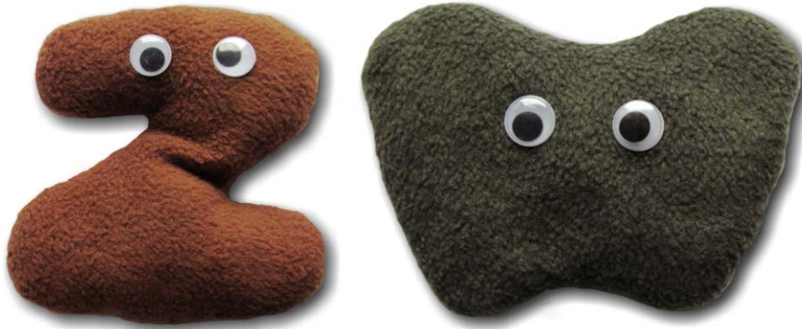
18. ábra. Két, kölcsönhatást közvetítő részecske a Z- és a W-bozon.

szecskegyorsítóban, amely a CERN Nagy Hadronütköztetőjének 2008-as üzembe helyezéséig a világ legnagyobb energiájú részecskegyorsítója volt. 1995-ben ugyanitt figyelték meg a hatodik, a top kvarkot (17. ábra). A kvarkoknál is beszélhetünk – hasonlóan a leptonokhoz – első (up, és down), második (charm és strange) és harmadik (top és bottom) részecskecsaládról. E kvarkcsaládok – hasonlóan a már említett elektronhoz, müonhoz és tau-részecskéhez – egyre nehezebbek, a figurák számvonalainak száma most is erről árulkodik. A harmadik részecskecsaládba tartozó top kvark tömege a proton tömegének 175-szöröse. Jegyezzük meg, hogy a részecskék esetében a tömeget nem a szokásos kilogrammban adják meg, hanem az Einstein-féle tömeg-energia ekvivalencia egyenlet alapján eV/c^2 -ben fejezik ki! Így a proton tömege 1 \text{ GeV}/c^2 , a top kvark tömege 175 \text{ GeV}/c^2 . Lényeges hangsúlyozni, hogy ez a nyugalmi tömeget fejezi ki, hiszen a részecskegyorsítóban a relativisztikus tömegnövekedést is figyelembe kell venni. A megtárgyalt hat kvark kapcsán lezárásul elmondhatjuk, hogy 2008-ban az a három japán elméleti fizikus kapta meg a Nobel-díjat, akik megjósolták, hogy 6 kvarktípusnak kell lennie a természetben.