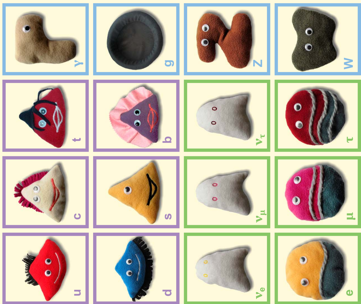
Jelmagyarázat: a részecske tulajdonságait leíró téglalapban középén a részecske jele, fölötté nyugalmi tömege, balra elektromos töltése, alatta spinje, alul pedig teljes neve.