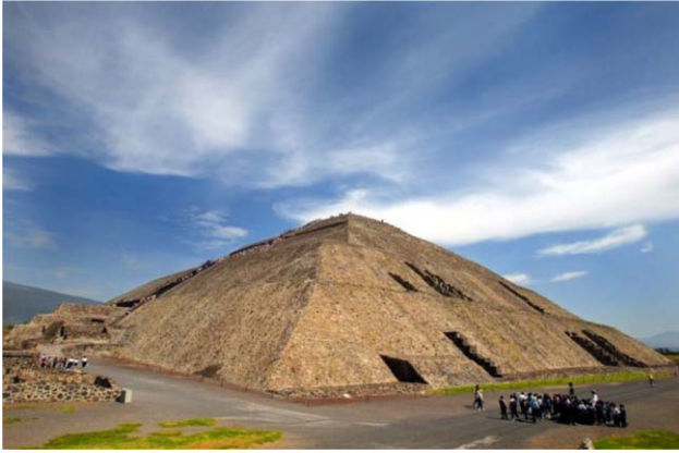
10. ábra. A Nap-piramis Mexikóban. http://multkor.hu/20080707_osi_titkokat_keresnek_a_mexikoi_nappiramis_alatt