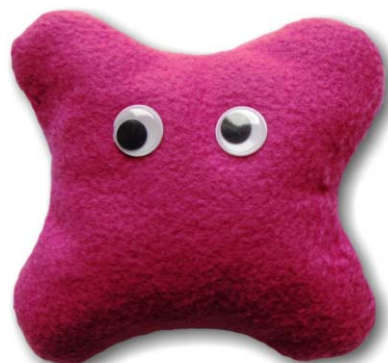
19. ábra. A Standard modell 2012-ig kísérletileg hiányzó részecskéje, a Higgs-bozon.

A gyenge kölcsönhatás vizsgálatakor derült ki, hogy a kvarkok és leptonok 3 részecskecsaládba sorolhatók. Az első családba tartozók a legkönnyebbek, ezt a figurákon az egyszeres számvonal, vagy hullámvonal jelzi, ha kézbe vesszük a bábukat, érezzük, hogy nagyon könnyűek. A második részecskecsalád elemeinél már dupla számvonalat (hullámvonalat) terveztem és a tömőanyag is nehezebb, ahogy a valóságban is nehezebb részecskékről van szó. A harmadik részecskecsaládnál ennek megfelelően hármasszámvonal (hullámvonal) látható és a tömőanyag itt a legnehezebb. Az antianyagot mindössze egy bábuval szemléltetem (20. ábra), hiszen céloom kifejezetten a Standard modell részecskéinek bemutatása volt, de számítógép képernyőjén könnyen láthatjuk bármelyik részecske antirészecskéjét is a „a színek invertálása” vagy a „negatív-készítés” menüponttal.