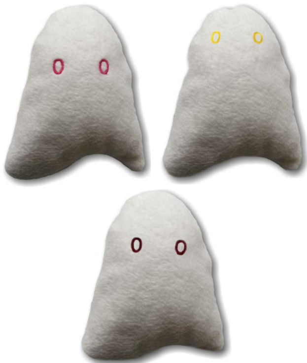
14. ábra. A három féle neutrínó.

ző Pell-lel együtt – kapott Nobel-díjat Frederick Reines . Pauli, amikor értesült a kísérleti bizonyítékról, választáviratában a következőt írta: „Köszönöm az üzenetet, minden megérkezik annak, aki tudja, hogy hogyan kell rá várni.” Fontos megjegyezni, hogy két magyar kutatónak, Csikai Gyulának és Szalay Sándornak – szintén 1956-ban – ködkamrában sikerült kimutatnia és fényképfelvételeken rögzítenie a neutrínó magvisszalökő hatását (13. ábra). Ezeket a felvételeket 1957-ben publikálták.