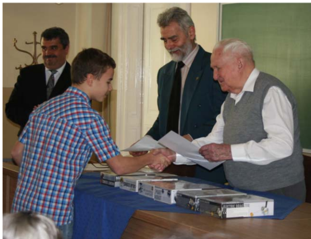
Tanár úr idén április 16-án, a Bor Pál-verseny díjátadóján.

Fizikus Vándorgyűléseken (1959, 1973, 1983), tanári ankétokon, a szegedi ötvenedikén az Ankét ezüstözött emlékérmét kaptam.