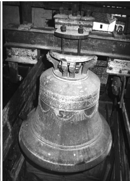
A Vártemplom 1834-ben öntött nagyharangja, a szerző felvételei.