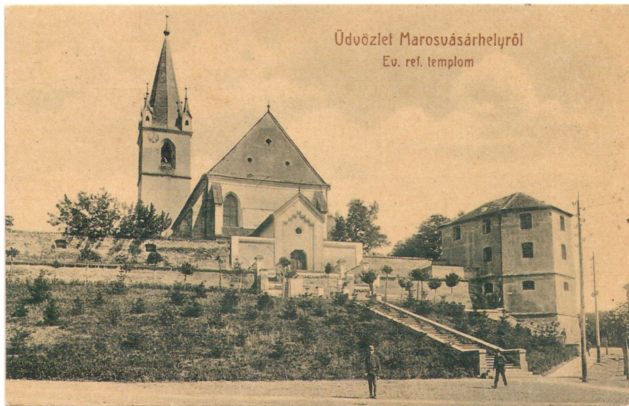
A Vártemplom egy 1908-as képeslapon.