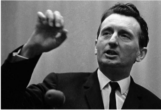
Alekszandr Mihajlovics Prohorov