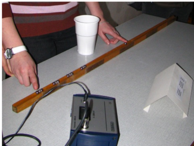
3. ábra. „Gauss-puska” kilövési kísérletek.

Eredeti célkitűzésünk a fizika népszerűsítése volt iskolán belül és kívül. Úgy érezzük, hogy sokak számára „kézzelfoghatóbb” lett ez a tudomány, ami különösen fontos manapság, mikor lépten, nyomon halljuk közismert emberektől is, hogy mennyire nem szerették a fizikát, matematikát, kémiát annak idején. Különösen fontosnak érezzük a reáltudományok iránti érdeklődés felkeltését akkor, amikor ország-szerte egyre kevesebb természettudományos tanár