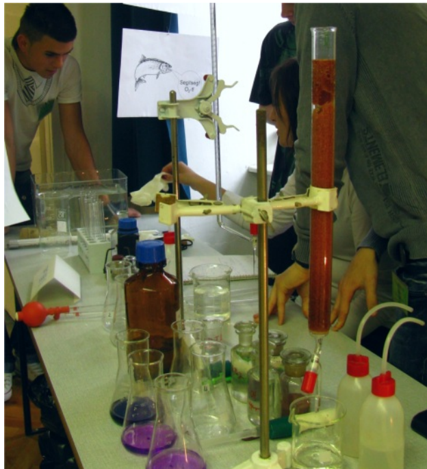
5. ábra. A 12. osztályosok ioncserélő kísérletei.

végez, a reálértelmiség létszáma drasztikusan csökken. Amennyiben ez tovább folytatódik, úgy a nagy természettudományos múlttal büszkélkedő hazánk a világranglistán sereghajtó lesz, műszaki-természettudományos értelmisége eltűnik.