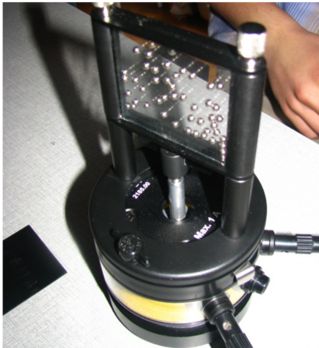
4. ábra. Ideális gázok kinetikus modellje.