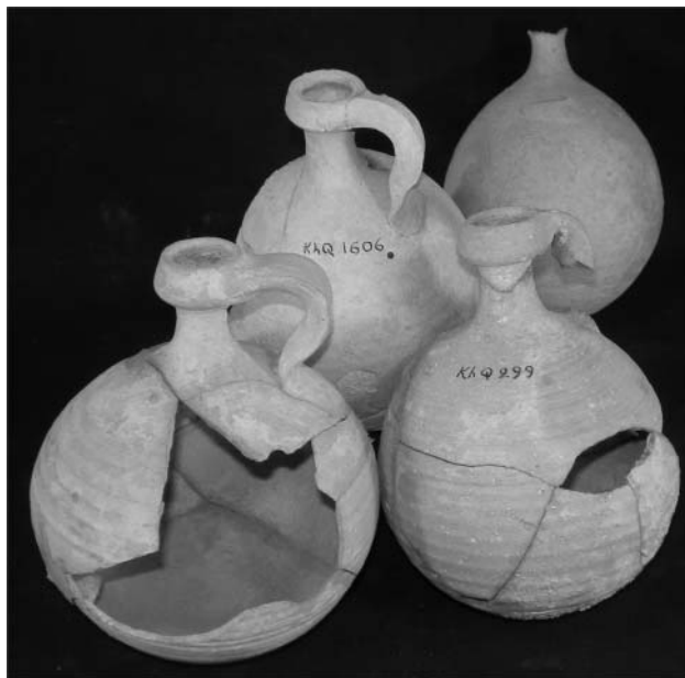
1. ábra. Néhány kumráni kerámiaedény.

Mivel az NAA-vizsgálatok a BME Nukleáris Technikai Intézetében történtek, annyi részrehajlást megengedünk magunknak, hogy ezeket a többenél részletesebben ismertessük. Az agyag kémiai összetételét jelentő elemek egy részének aránya többé-kevésbé megfelel a sztöchiometriának, más részük viszont nagyon kis arányban előforduló nyomelem. Az előbbiek aránya meglehetősen kötött, így lényegében független a származási helytől, de a nyomelemek mennyisége helyről helyre változhat, viszont az azonos helyről származó agyagokban bizonyos mértékű állandóságot mutat. Találó hasonlattal úgy szokták mondani, hogy az agyagtárgyak nyomelem-összetétele a származási hely (kerámiaműhely) ujjlenyomatának tekinthető. Ha tehát vannak ismert származási helyű tárgyak, ezek nyomelem-összetételét egy ismeretlen eredetű tárgyéval összehasonlítva jó valószínűséggel ki tudjuk választani a származási helyet, illetve