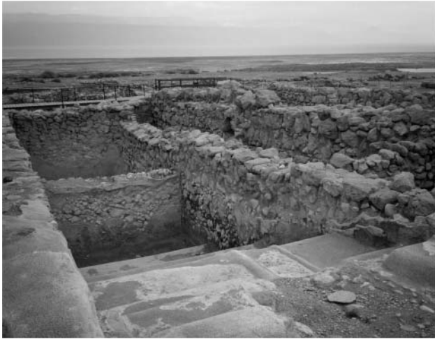
4. ábra. Rituális fürdő Kumránban.

Négy kérdést tettek fel: 1. a szál anyaga; 2. a szövés vagy kötés technikája; 3. a használt szerves vagy szervetlen festék anyaga; 4. a textilek kora.