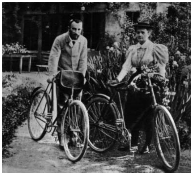
6. ábra. Pierre és Marie Curie 1906-ban.