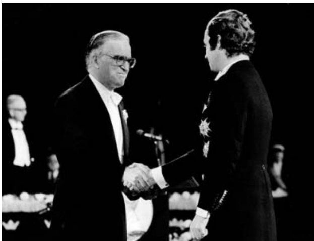
5. ábra. Aage Bohr a Nobel-díj átvételekor.

A cseppmodell az atommagot alkotó nukleonok kollektív mozgására, a héjmodell pedig a nukleonok egyedi mozgására ír elő szabályokat. A kollektív modell a két, látszólag egymásnak ellentmondó modell összehangolásával számot tud adni az atommag deformációjáról, vibrációjáról és rotációjáról is. Modelljüket újra és újra összevetették a friss kísérleti adatokkal, ha kellett finomították a modellen, de mindig sikerült megtalálni az összhangot az elmélet és a kísérletek között.