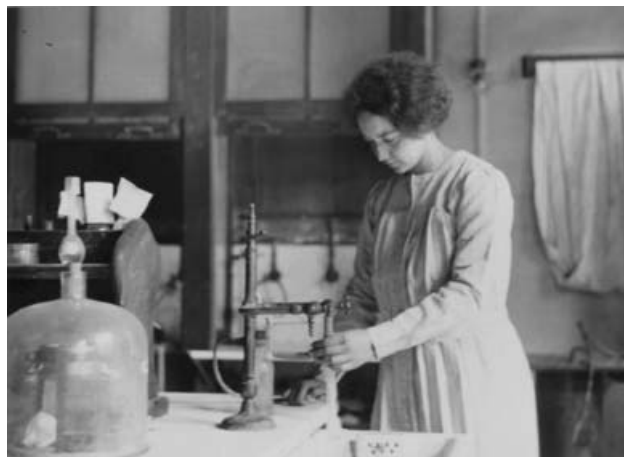
9. ábra. Irène Curie a Rádium Intézet laboratóriumában.

A háború kitörését követően Irène Curie Angliában töltött egy évet, majd anyja hívására 18 évesen vissza-