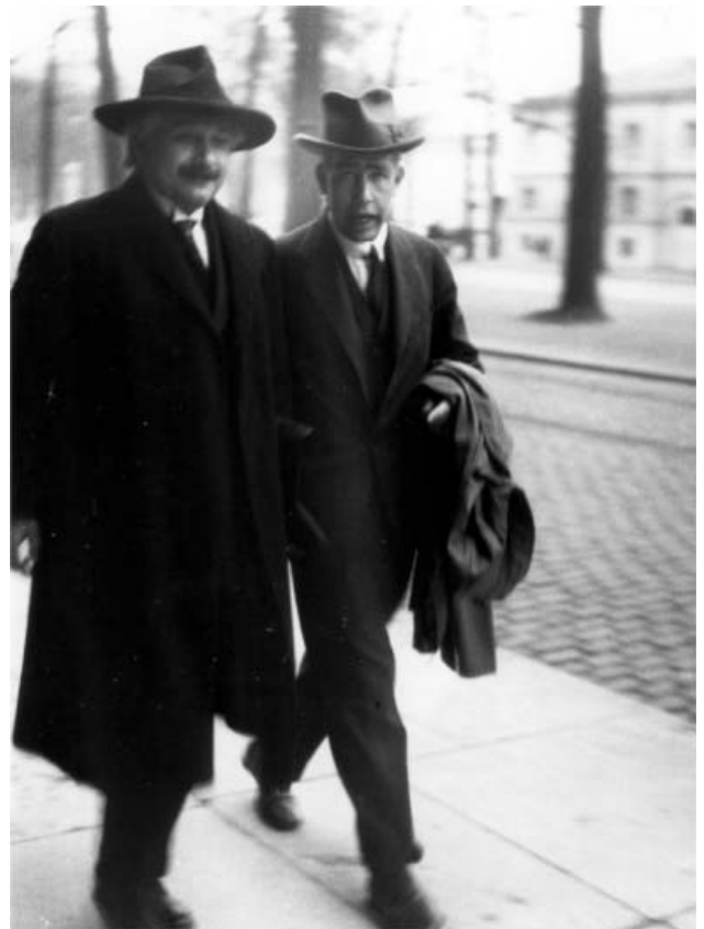
2. ábra. Niels Bohr és Albert Einstein az 1930-as Solvay-konferencián, Brüsszelben.

1922-ben megkapta a fizikai Nobel-díjat „az atomok szerkezetének és az azokból eredő sugárzásoknak a vizsgálatáért”. Felmentették az egyetemi előadá-