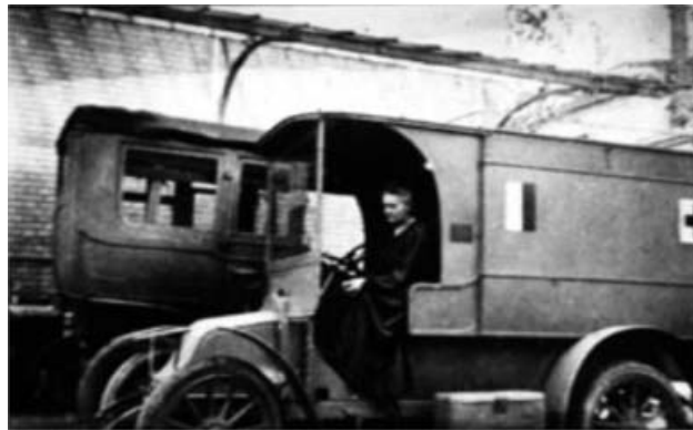
8. ábra. Marie Curie az általa berendezett radiológiai mentőautó volánjánál.

1908-ban a Sorbonne professzorává nevezték ki, ő lett az első női professzor Franciaországban. Ebben az évben sikerült tiszta fémrádiumot előállítania. 1910-ben elfogadta a jelölést a Francia Tudományos Akadémia tagságára. Itt is ő lett volna az első nő, de a sajtóban hadjárat indult az „idegen nő” ellen és a választáson 26:28 arányban alulmaradt a minden szempontból megfelelő francia férfiúval szemben. Se neki, se a lányának nem sikerült bekerülnie a Francia Tudományos Akadémia tagjai közé. Némi elégtétel Marie Cu-