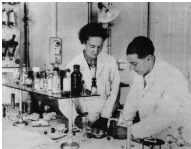
10. ábra. Irène és Frédéric Joliot-Curie.

1935-ben a kémiai Nobel-díjat a Joliot-Curie házaspárnak ítelték az általuk felfedezett „új, mesterséges radioaktív izotópok kémiája területén végzett munkájukért”. Langevin javaslatára ettől kezdve közös néven publikáltak, s így szerepeltek a napilapokban is: Irène Joliot-Curie és Frédéric Joliot-Curie.