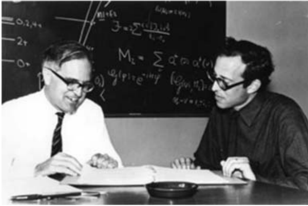
4. ábra. Aage Bohr és Ben Mottelson.

mutatkozó érdekességekre. Többek között arra, hogy az atommagbéli töltésselészlás nem tűnik gömbszimmetrikusnak. Lehet, hogy az atommag nem gömb alakú, ahogyan az Niels Bohr cseppmodelljéből következik? Aage Bohrt rendkívül izgatta ez a probléma, igazi kutatói szenvedéllyel csapott le rá és azonnal dolgozni kezdett rajta. Közben 1950-ben, New Yorkban feleségül vette az osztrák születésű Marietta Soffert (?–1978). Három gyermekük született az idők folyamán: Vilhelm , Tomas és Margrethe .