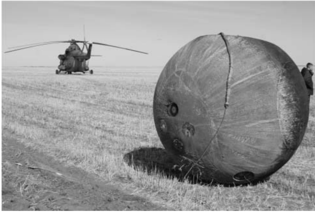
2. ábra. A Foton-M3 visszatérő egysége, amelynek külső felületén a STONE-6 kísérlet kőzetmintái kaptak helyet.