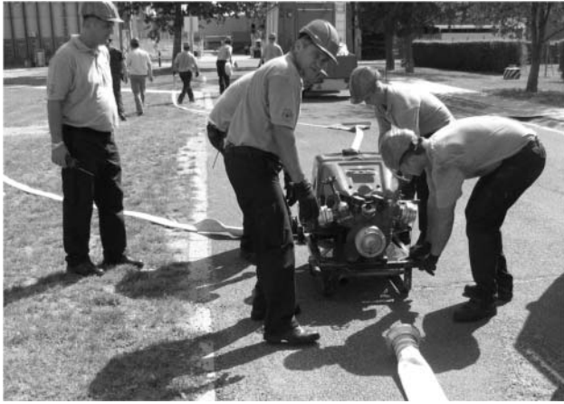
3. ábra. A mobil vízvételi rendszer telepítése.

a gőzfejlesztőkben keletkező gőz elvitele csak a korábban már leírt módon az atmoszférába történhet, így a rendszerben lévő vízkészlet folyamatosan fogy, de értékelésünk szerint így is több mint 3 napig biztosítható a blokkok hűtése.