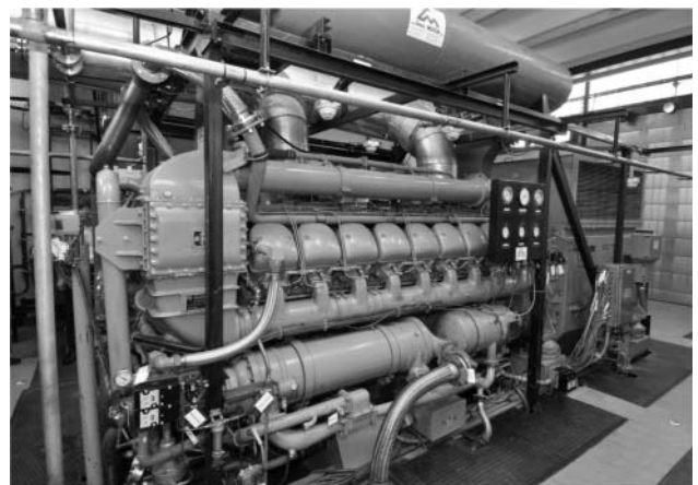
1. ábra. A II. kiépítés biztonsági dízelgenerátora.

A normál betáplálás kiesése esetén a szünetmentes betáplálást akkumulátortelepek biztosítják. Ezek tervezetten 3,5 órán át képesek a méréseket táplálni és a