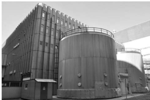
2. ábra. A II. kiépítés sótalanvíz-rendszerének tartályai.

Amennyiben valamilyen külső oknál fogva megszűnik a vízkivétel a Dunából leágazó hidegvíz csatornából, a rendszerek vízellátása megszűnik. A biztonsági hűtővízellátás megszűnése miatt a blokkok leállnak, leállnak a primerkörü szivattyúk, így a primer kör hűtése természetes cirkulációs üzemmódban történik. A hűtővíz elvesztése egyben azt is jelenti, hogy