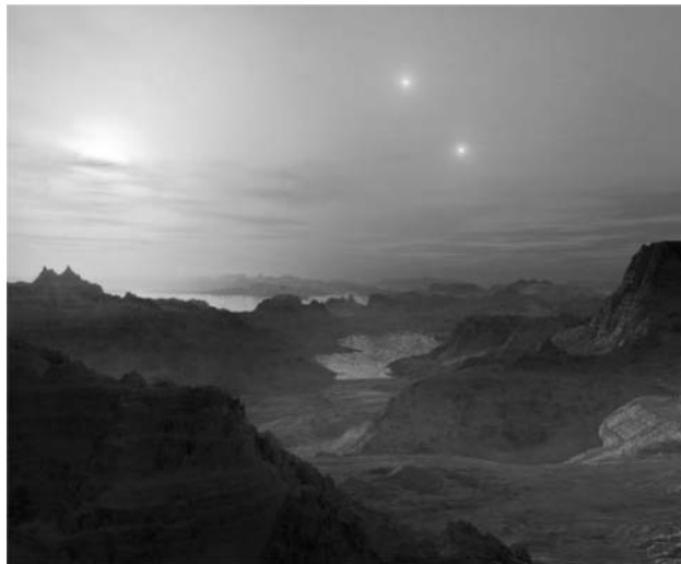
2. ábra. Fantáziakép a Gliese 667Cc-ről, ahol három „Nap” is ragyog az égen. Ez az exobolygó egyike annak a kilencnek (2012. decemberi állapot szerint), amelyek akár lakhatók is lehetnek.

Mai ismereteink alapján úgy gondoljuk, hogy élet a csillagok körül az úgynevezett lakhatósági zónán belül keringő exobolygókon vagy holdjaikon lehetséges, ezért is fontos ezek keresése, tulajdonságaik vizsgálata, ami csak fizikai, asztrofizikai kutatásokkal lehetséges. Diákjaink is sokszor találkoznak földönkívüli világokkal a filmekben és a számítógépes játékokban. A távoli bolygók, bolygórendszerek ismerete segít saját planetánk és Naprendszerünk megismerésében is.