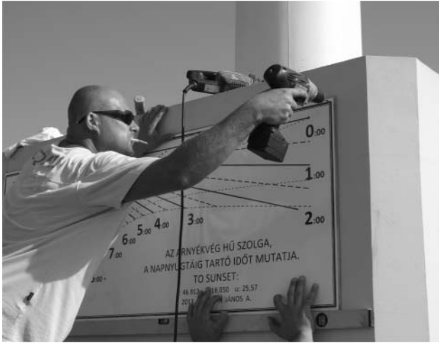
2. ábra. A napóra felszerelése.

lehet látni, mennyi ideig lesz még világos, hiszen e rendszer kialakításakor a mécses és a fáklya luxuscikk volt, amely nemcsak drága, de rossz szagú is. Ez az időszámítási mód a közlekedési repülés területén manapság is előfordul. Ugyanis a komolyabb navigációs berendezések nélküli kis repülőgépek csak nappal, azaz a napnyugta előtt repülhetnek. Ezek számára adhat közvetlen adatot a még hátralévő repülési-hajózási időtartamról az ilyen fajta időszámítás.