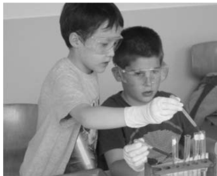
egy kis kémia