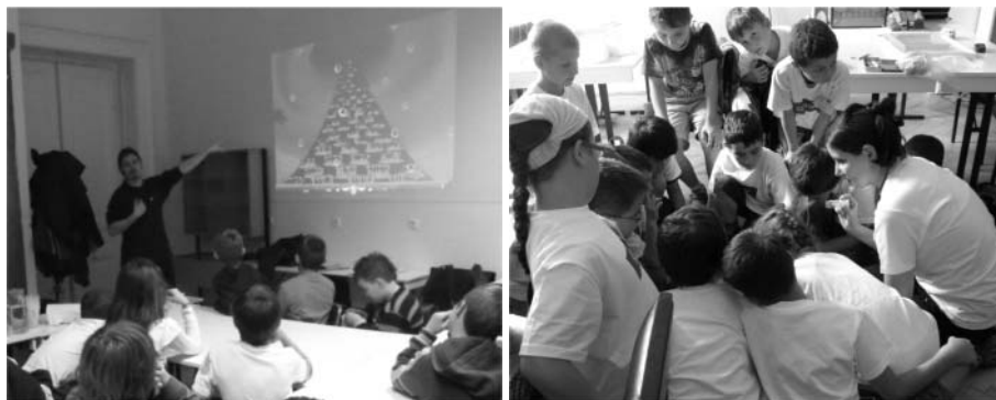
Nyári tábor: előadástól a játékig.

A nyári táborok sokban hasonlítanak a szakköri foglalkozásokra, de a táborban sokkal több idő áll rendelkezésre, vagyis kényelmesebben elidőzhetünk egy-egy részproblémánál. Az alapelvek azonosak, sőt a több idő miatt az egyéni kreativitásnak, ha lehet, még több teret tudunk biztosítani. Hasonló a foglalkozások felépítése is. Mind a szakköri alkalmakkor, mind a táboros napok kezdetén a gyerekek lehetőséget kapnak a természettudományos elveket, törvényeket alkalmazó játékszerekkel történő szabad játékra. Ez kellemes alaphangulatot segít teremteni, amely meghatározza a későbbi hozzáállásukat. A játékok remek segítséget nyújtanak abban, hogy megmutassuk a tudomány mennyire egyszerűen van jelen mindennapjainkban, leggyorsabb tárgyainkban. A témakörök bevezetéséhez előszeretettel használunk mesefilmeket. Kis kutatással könnyedén található olyan rajzfilmek, amelyek tudó-