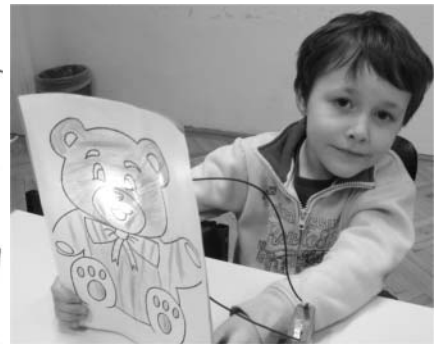
világít a maci orra