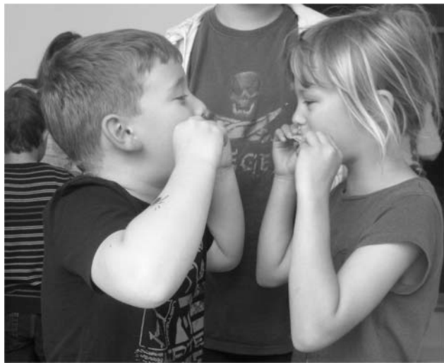
A szendvicsduda és a kis „művészek”.