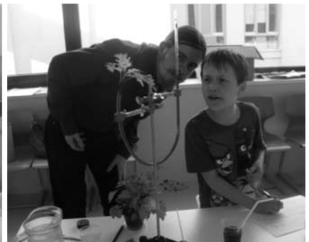
potométer 6 tanulmányozása

senki nem fogja számon kérni, hogy miért nem „játsoztunk” idén a gyerekekkel például elektromosságot. Hiszen itt nem a konkrét tematika teljesítése a lényeg, hanem az, hogy a gyerekek ismerjék meg a természettudományos vizsgálódás módszereit, idejük egy részét játékos kísérletezéssel töltsék, és közben személyiségükben formálódjanak. Ezekkel a foglalkozásokkal megakadályozzuk, hogy elfojtsák természetes kíváncsiságukat, olyan erős érzelmet ébresztünk bennük a természet megismerése iránt, amit hitünk szerint később sem fognak elveszíteni. Ez a hipotézisünk, igazolásához még időre van szükség, hiszen a gyerekek nagy része, akik az első szakköreinken vettek részt, még nem tanul diszciplináris természettudományt az iskolában.