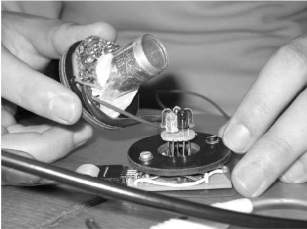
2. ábra. A diákok által épített LED spektrométer.

fizikai vagy kémiai változások, illetve ezek elektromos jellé való átalakítása révén lehet detektálni.