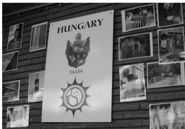
Iskolánk bemutatkozó posztere.

Két asztallal arrább egy magyarországi csapat csalogatta a látogatókat látványos szemléltető eszközeivel. Az üllési Fontos Sándor Általános Iskola (Szegedtől 26 km-re) hat hetedikes, illetve nyolcadik osztályos diákjait