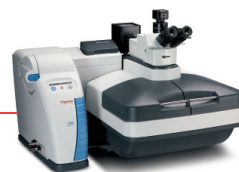
DXR™xi Raman képképző mikroszkóp

Nagyteljesítményű, integrált Raman képképző rendszer