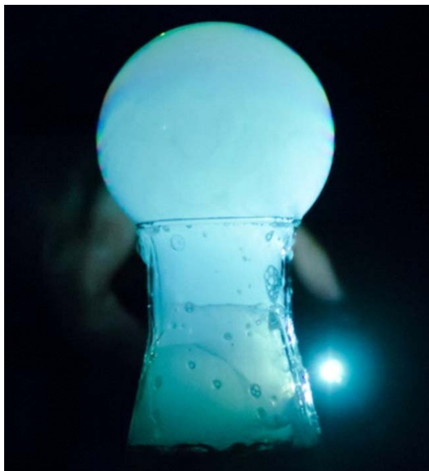
2. ábra. Szappanbuborék-fújás nitrogénnel.

Légágyú készítése házilag igen egyszerű, egy nagyobb tartályra, rugalmas oldalfalra és egy szűk, kör keresztmetszetű nyílásra van szükségünk. E célra akár egy 1,5 literes PET-palack is tökéletesen megfelel. A palack oldalát picit összenyomva levegő áramlik ki az üveg száján, és egy önmagába visszaforduló gyűrűt képez, amely az edény szájára merőleges irányban egyben maradván távolodik az „ágyútól”. Ezzel a módszerrel távolról elfújható például egy gyertya lángja is. A keletkező gyűrű szemléltetésére a palackba egy