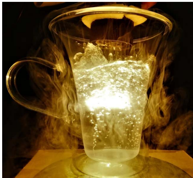
5. ábra. Villanykörte izzószála cseppfolyós nitrogénben.

Egy egyszerű villanykörte üvegburkolatát eltávolítva, majd izzószálát feszültség alá helyezve a szál pár pillanat alatt elég. A körtében eredetileg megtalálható védőgáz oxigénmentes volt, ezért az izzásban lévő szál oxigén hiányában nem oxidálódhatott, nem éghetett el. Ha az üvegburkolat nélküli izzószálát cseppfolyós nitrogénbe merítjük, és így helyezzük feszültség alá, a szál szépen világít (5. ábra). A cseppfolyós nitrogénben a védőgázéhoz hasonló oxigénmentes állapotban a szál sokkal tovább képes világítani. (Megjegyzem, hogy egy kevés oxigén mindig kondenzálódik a cseppfolyós nitrogénben, ezért percek után a szál mégiscsak eloxidál.) A világító izzószál a forrásban lévő nitrogénen belül igen látványos, érdemes elsötétítet-