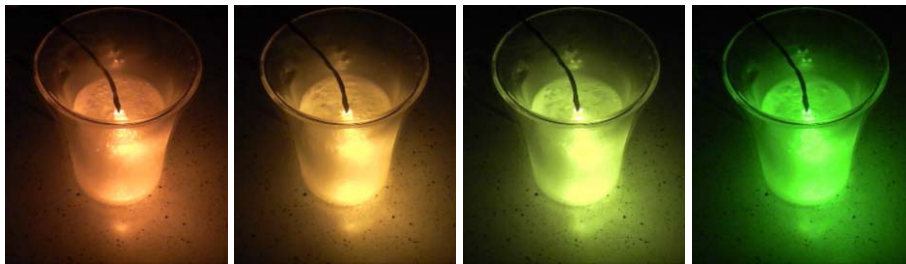
6. ábra. Narancssárga LED fényváltása a hűtés során.

A jelenség magyarázata, hogy a félvezetők hűtésekor a tiltott sáv kissé kiszélesedik, ezáltal a kibocsátott fény hullámhossza csekély mértékben megnő (6. ábra) [4]. Az előző kísérlethez hasonlóan ezt is érdemes elsötétített teremben, illetve duplafalú üvegedényben tárolt nitrogénben elvégezni.