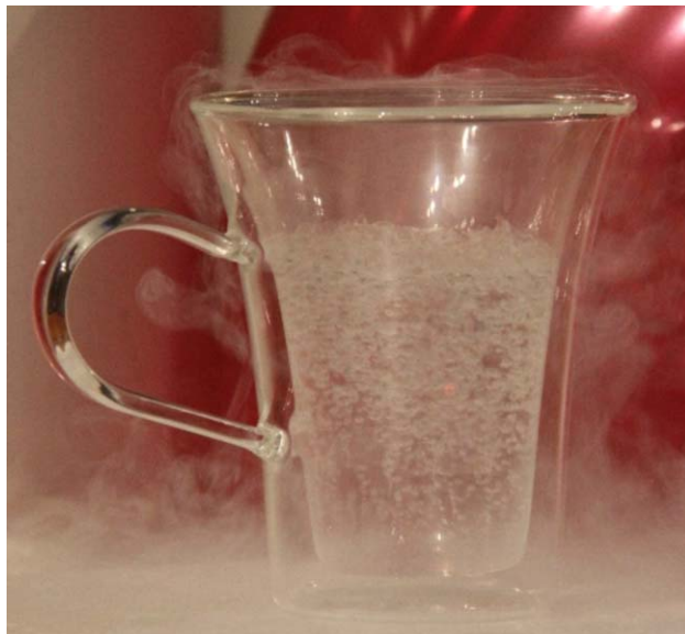
1. ábra. Cseppfolyós nitrogén Dewar-edényben.

Szappanos vagy mosogatószeres víz segítségével vékony hártát vonhatunk egy edény szájára, amelybe előzetesen vizet, majd arra pár csepp nitrogént töltötünk. Az elforró nitrogén felfújja a buborékot, aminek belsejében a víz és a hideg nitrogéngáz miatt átlátszatlan köd jön létre (2. ábra). Igen látványos, ahogy a buborék kipukkanásakor a köd még egy pillanattal megtartja a formáját. Érdekes minél szélesebb szájú edényt használni, illetve a mosogatószeres vízzel előzetesen bekenni az edény száját. A kezdeti hártát