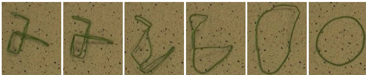
4. ábra. „Emlékező műanyag” melegedése.