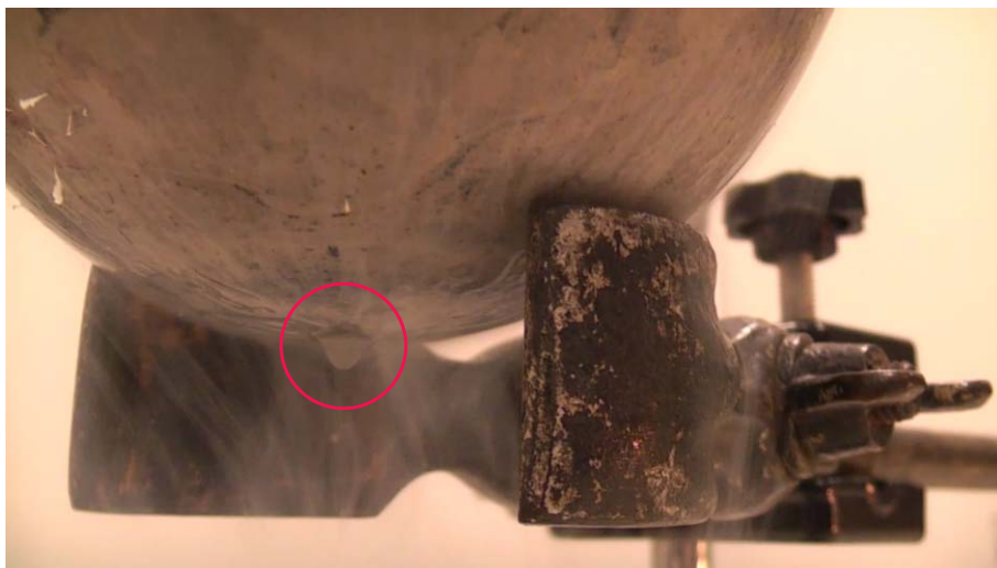
7. ábra. Cseppfolyós oxigén kondenzációja.