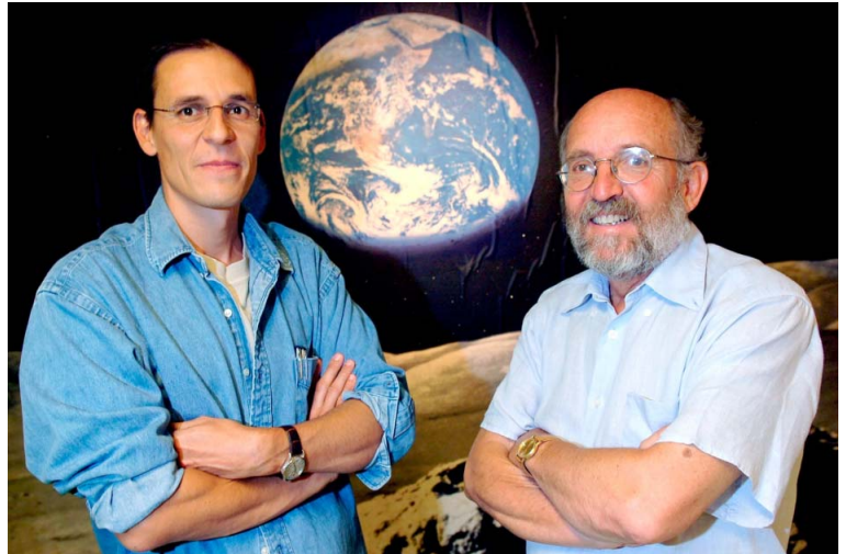
Didier Queloz és Michel Mayor

Mivel a nagyobb tömegű bolygók nagyobb, így könnyebben kimutatható változásokat okoznak egy csillag sebességében, az elsők között felfedezett exobolygók mind nagy, a Jupiteréhez hasonló vagy még annál is nagyobb tömegűek voltak. Bár ez a módszer határozottan eredményes, és a mai napig fedeznek fel így exobolygókat, illetve erősítenek meg más módon felfedezett exobolygó-jelölteket, az új