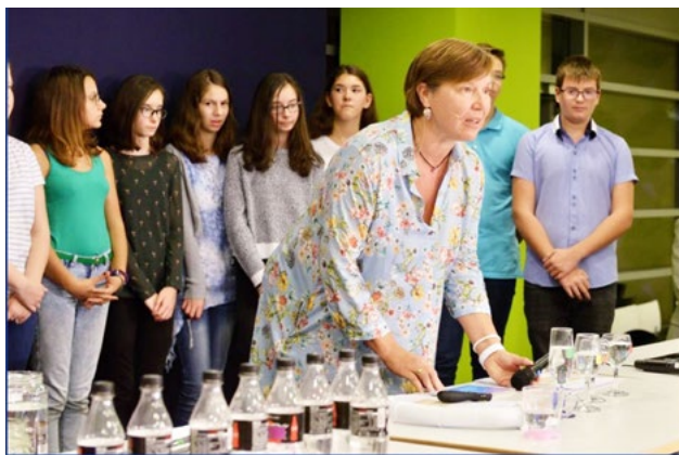
5. ábra. A fizika és a zene kapcsolata (2017-es Kutatók Éjszakája)

A tanárnő már harmadszor is vendége volt ennek a rendezvénynek, diákjaival saját készítésű hangszerekkel hívták közös zenélésre a résztvevőket, és a közös éneklésnek köszönhetően egy fantasztikus hangulatot alakítottak ki (5. ábra).