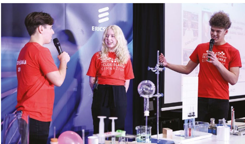
8. ábra. Egyeztetés a hőmérsékleti skálákról

Az újabb jelenetben, új szereplőkkel a lineáris hőtágulás gyakorlati életben való fontosságát, majd a gázok hő hatására bekövetkező tágulását ismerhettük meg kísérlettel, magyarázattal (8. ábra).