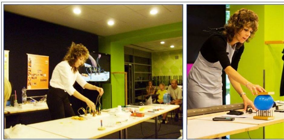
2. ábra. A krumplióramforrás és a fakirágy bemutatása

A rendezvényre évről évre több és több diák jött el, de egy-egy 20 perces előadásra maximum 80–100 fő fért be a régi terembe. Ám a termen kívül rekedt nézők sem maradnak kísérlet nélkül, ők a terem előtt, monitoron nézhatték és hallgathatták a bemutatókat, majd a szünetben cseréltek helyet a bent ülőkkel. Természetesen azokra a nézőkre is gondoltunk, akik otthon maradtak, és onnan szerették volna szemlélni az eseményeket, vagy a rendezvénnyel egy időben más helyszínrre látogattak. Az est teljes ideje alatt élő internetes közvetítés volt, illetve később az archívumból minden előadás le-tölthető, megtekinthető volt. Egyik előadóként a hallgatóknak a krumplióramforrást, a fakirágyat, a hajam és a lufi közötti dörzsölés eredményét mutattam be az érdeklődőknek (2. ábra).