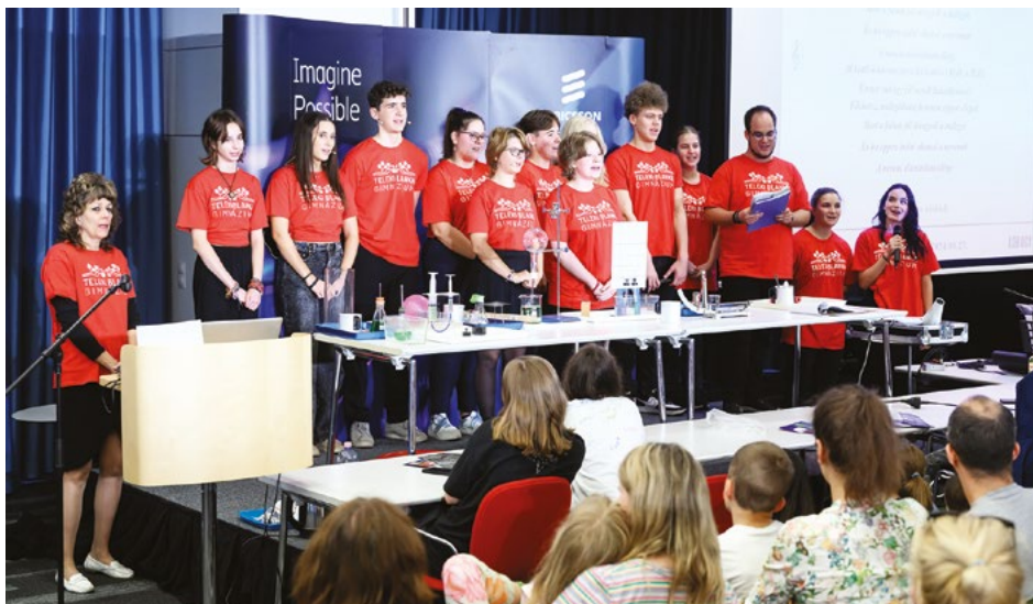
7. ábra. Kutatók Éjszakája 2024